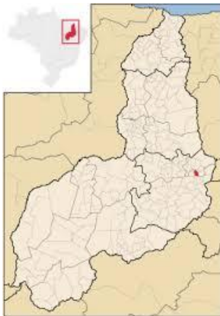
Localização de Vila Nova do Piauí – PI

O município está localizado na microrregião de Alto Médio Canindé, compreendendo uma área de 179,20 km 2 e tendo como limites o município de São Julião ao norte, ao sul com Padre Marcos, a leste com Alegrete do Piauí e, a oeste com Campo Grande do Piauí e Padre Marcos. A sede municipal tem as coordenadas geográficas de 07°08'08" de latitude sul e 40°56'24" de longitude oeste de Greenwich e dista cerca de 366 km de Teresina.